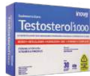
Testosterol 1000 c/ 30 comp. | cód 750617