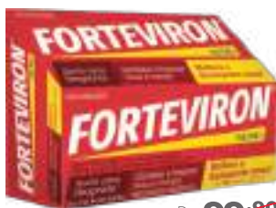
Forteviron c/ 60 comp. | 250mg | cód. 88058