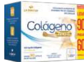
Colágeno Tipo II LA SAN-DAY Leve 90 Pague 60 cáps. | 40mg | cód. 737271