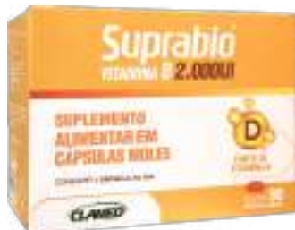
Suprabilo Vitamina D c/ 90 cáps. | 2000UI | cód. 743840 R$ 46,90 cada