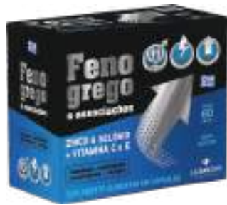
Feno Grego LA SAN-DAY c/ 60 cáps. | cód. 749011