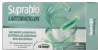
Suprabilo Probiótico Lactobacillus c/ 30 cáps. | R$ 64,90 cada cód. 745672 De: R$ 71,90