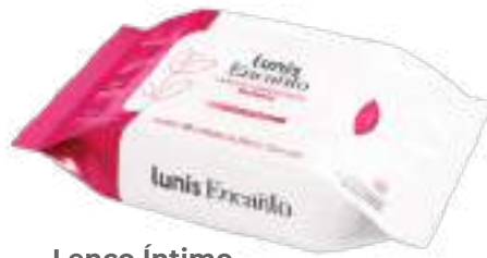
Lenço Íntimo Lunis Encanto c/ 16 unid. | R$ 6,99 cada cód. 748600