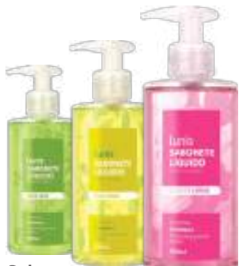
Sabonete Líquido Lunis 250ml | Todos os tipos R$ 10,90 cada