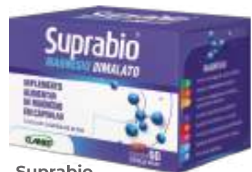
Suprabilo Magnésio Dimalato c/ 60 cáps. | 1200mg | cód. 744631 R$ 51,90 cada

ESTES PRODUTOS NÃO SÃO MEDICAMENTOS. NÃO EXCEDER A RECOMENDAÇÃO DIÁRIA DE CONSUMO INDICADA NA EMBALAGEM. MANTENHA FORA DO ALCANCE DAS CRIANÇAS.