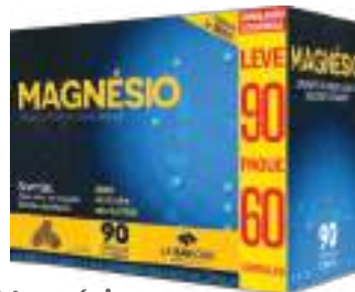
Magnésio LA SAN-DAY Leve 90 Pague 60 cáps. | cód. 732579