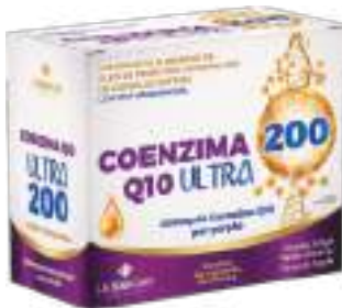
Coenzima Q10 Ultra 200 LA SAN-DAY c/ 60 cáps. | 200mg | cód. 746506