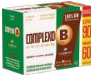
Complexo B LA SAN-DAY Leve 90 Pague 60 cáps. | cód. 741860