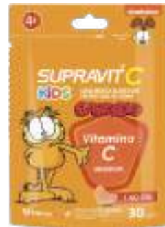
Supravit C Garfield Kids c/ 30 gomas | Todos os tipos