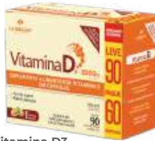
Vitamina D3 LA SAN-DAY Leve 90 Pague 60 cáps. | 2000UI | cód. 739069