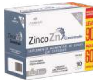
Zinco ZN Concentrado LA SAN-DAY Leve 90 Pague 60 cáps. | cód. 739072