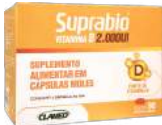
Suprabo Vitamina D c/ 90 cáps. | 2000UI | cód. 743840 R$ 46,90 cada