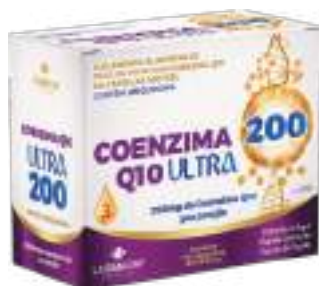
Coenzima Q10 Ultra 200 LA SAN-DAY c/ 60 cáps. | 200mg | cód. 746506