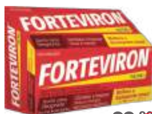
Forteviron c/ 60 comp. | 250mg | cód. 88058