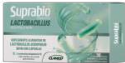
Suprabo Probiótico Lactobacillus c/ 30 cáps. | R$ 64,90 cada cód. 745672 De: R$ 71,90