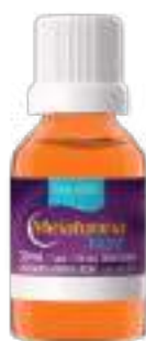
Melatonina Fast Equaliv

30ml | 210mcg/gota | Sabor Menta | cód. 741456