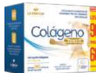
Colágeno Tipo II LA SAN-DAY Leve 90 Pague 60 cáps. | 40mg | cód. 737271