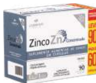
Zinco ZN Concentrado LA SAN-DAY Leve 90 Pague 60 cáps. | cód. 739072