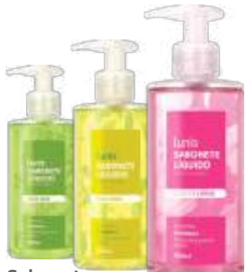
Sabonete Líquido Lunis 250ml | Todos os tipos R$ 10,90 cada