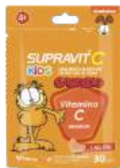
Supravit C Garfield Kids c/ 30 gomas | Todos os tipos