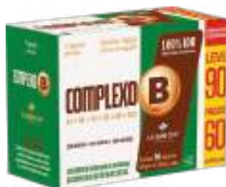
Complexo B LA SAN-DAY Leve 90 Pague 60 cáps. | cód. 741860