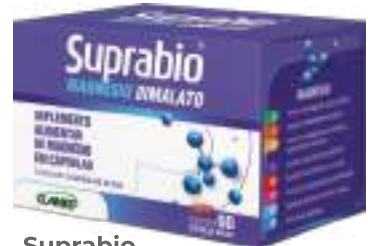
Suprabo Magnésio Dimalato c/ 60 cáps. | 1200mg | cód. 744631 R$ 51,90 cada

ESTES PRODUTOS NÃO SÃO MEDICAMENTOS. NÃO EXCEDER A RECOMENDAÇÃO DIÁRIA DE CONSUMO INDICADA NA EMBALAGEM. MANTENHA FORA DO ALCANCE DAS CRIANÇAS.