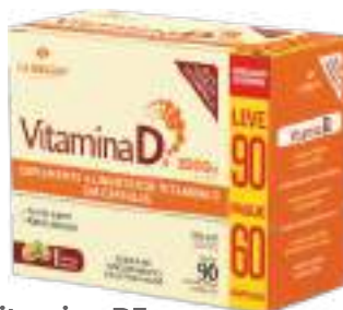
Vitamina D3 LA SAN-DAY Leve 90 Pague 60 cáps. | 2000UI | cód. 739069