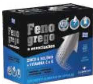
Fenogregó LA SAN-DAY c/ 60 cáps. | cód. 749011