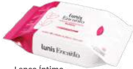
Lenço Íntimo Lunis Encanto c/ 16 unid. | R$ 6,99 cada cód. 748600