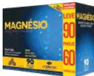
Magnésio LA SAN-DAY Leve 90 Pague 60 cáps. | cód. 732579