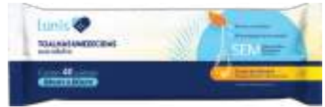
Toalhas Umedecidas Lunis c/ 40 unid. | Adulto | cód. 743314 R$ 9,99 cada