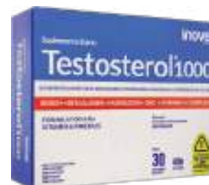
Testosterol 1000 c/ 30 comp. | cód 750617