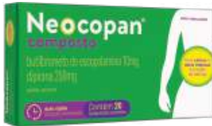
Neocopan Composto c/ 20 comp. | 10mg + 250mg | cód. 713339