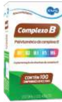
Complexo B EMS c/ 100 comp. | 35mg | cód. 682080