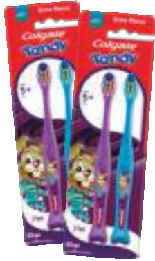
Escova Dental Colgate Tandy c/ 2 unid. | cod. 732707