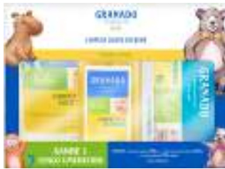
Sabonete Líquido + Refil Granado

250ml + 250ml | Grátis Lenço Umedecido | cód. 751527