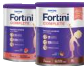
Fortini Complete 400g | Todos os sabores