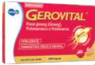
Gerovital c/ 60 cáps. | cód. 658447