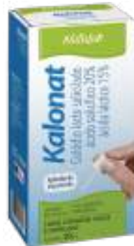
Kalonat 10ml | cód. 722384