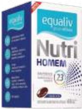
Equaliv Nutri Homem c/ 60 cáps. | cód. 727151