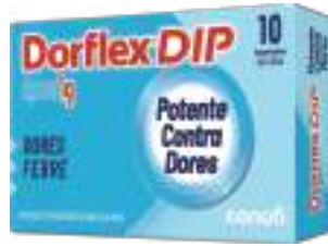
Dorflex DIP c/10 comp. | 1g | cód. 745706