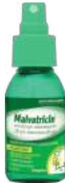
Malvatricin Spray | 50ml | cód. 610499