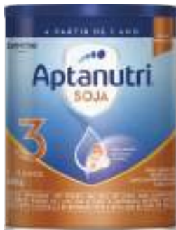
Aptanutri Soja 800g | cód. 747604