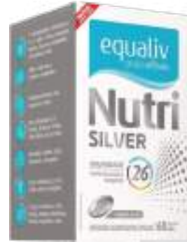
Equaliv Nutri Silver c/ 60 cáps. | cód. 727654