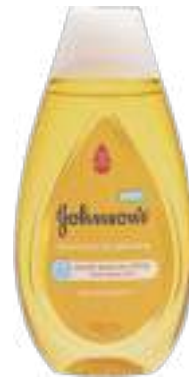
Shampoo Johnson's Baby