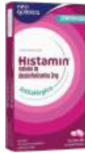
Histamin c/ 20 comp. | 2mg | Antialérgico | cód. 686683