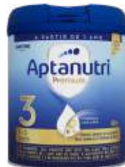
Aptanutri Premium 3 800g | cód. 718545