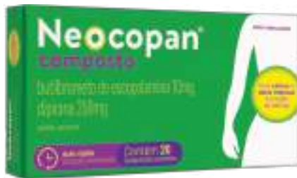
Neocopan Composto c/ 20 comp. | 10mg + 250mg | cód. 713339