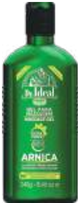
Gel para Massagem Arnica Dr. Ideal 240g | cód. 720847