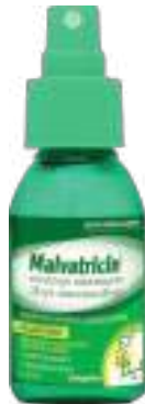
Malvatricin Spray | 50ml | cód. 610499