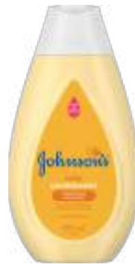
Condicionador Johnson's Baby