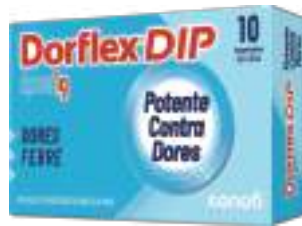
Dorflex DIP c/10 comp. | 1g | cód. 745706