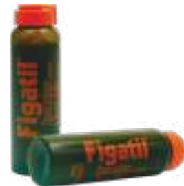
Figatil 10ml | cód. 691577