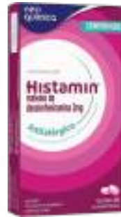
Histamin c/ 20 comp. | 2mg | Antialérgico | cód. 686683