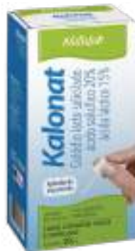
Kalonat 10ml | cód. 722384