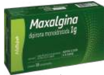
Maxalgina c/ 10 comp. | 1g | cód. 741851