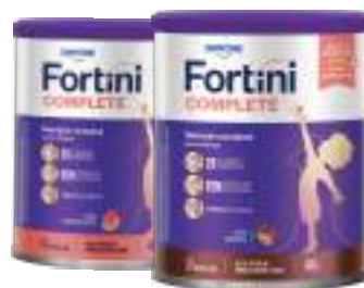
Fortini Complete 400g | Todos os sabores