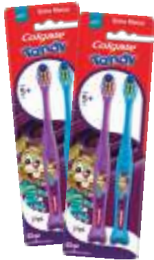
Escova Dental Colgate Tandy c/ 2 unid. | cod. 732707