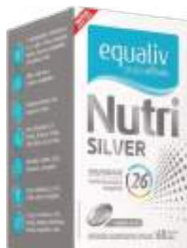
Equaliv Nutri Silver c/ 60 cáps. | cód. 727654