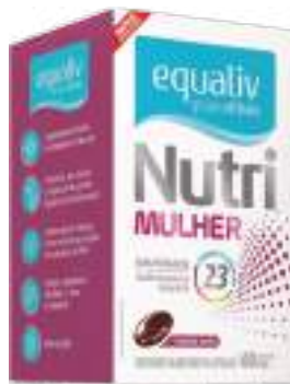
Equaliv Nutri Mulher c/ 60 cáps. | cód. 726588