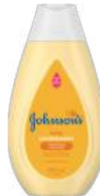
Condicionador Johnson's Baby