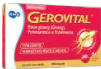
Gerovital c/ 60 cáps. | cód. 658447