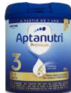
Aptanutri Premium 3 800g | cód. 718545