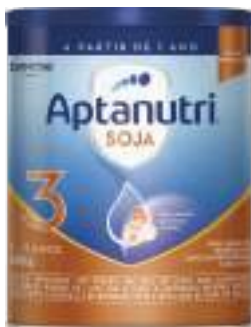
Aptanutri Soja 800g | cód. 747604