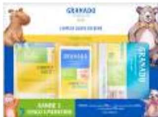
Sabonete Líquido + Refil Granado

250ml + 250ml | Grátis Lenço Umedecido | cód. 751527