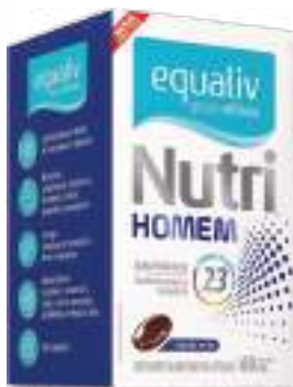
Equaliv Nutri Homem c/ 60 cáps. | cód. 727151