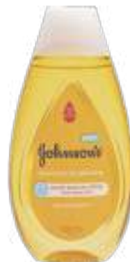
Shampoo Johnson's Baby