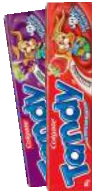
Gel Dental Colgate Tandy