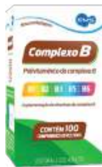
Complexo B EMS c/ 100 comp. | 35mg | cód. 682080