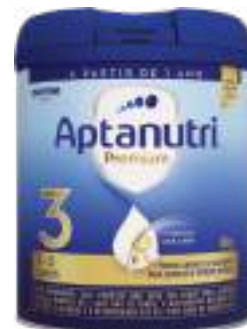
Aptanutri Premium 3 800g | cód. 718545