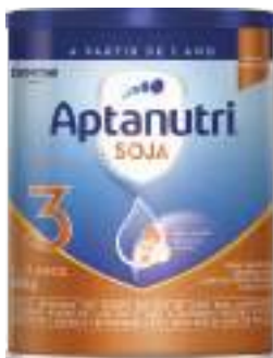
Aptanutri Soja 800g | cód. 747604