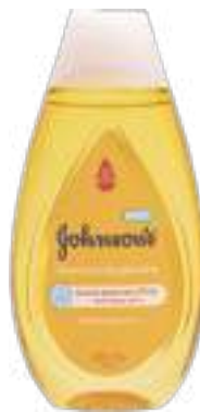
Shampoo Johnson's Baby