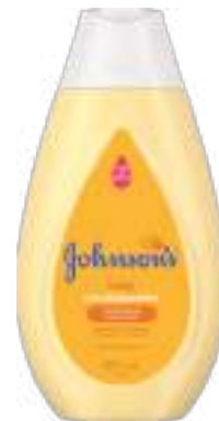
Condicionador Johnson's Baby