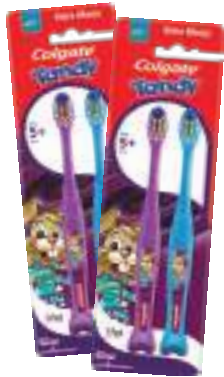
Escova Dental Colgate Tandy c/ 2 unid. | cod. 732707