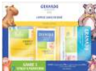
Sabonete Líquido + Refil Granado

250ml + 250ml | Grátis Lenço Umedecido | cód. 751527