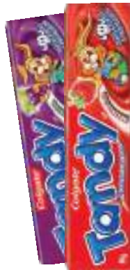
Gel Dental Colgate Tandy