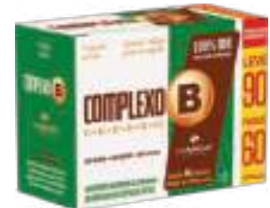
Complexo B LA SAN-DAY Leve 90 Pague 60 cáps. | cód. 741860