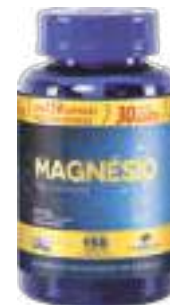
Magnésio Bisglicinato LA SAN-DAY Leve 150 Pague 120 cáps. | cód. 736309