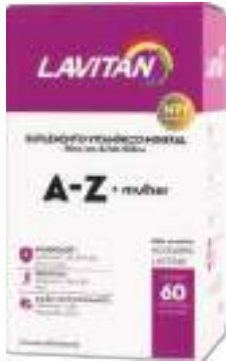
Lavitan A-Z + Mulher c/ 60 comp. | cód. 721507