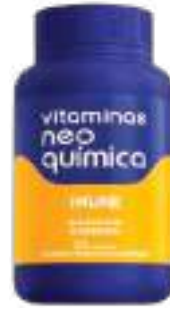
Vitaminas Neo Química Imune c/ 30 comp. | cód. 741299