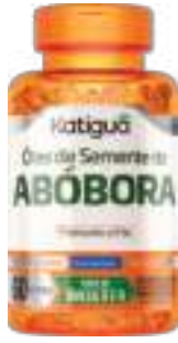
Óleo de Semente de Abóbora Katiguá c/ 60 cáps. | cód. 743914