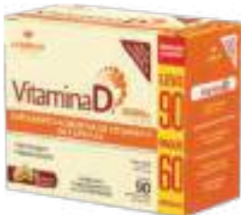
Vitamina D3 LA SAN-DAY Leve 90 Pague 60 cáps. | 2000UI | cód. 739069