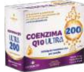
Coenzima Q10 Ultra 200 LA SAN-DAY c/ 60 cáps. | 200mg | cód. 746506