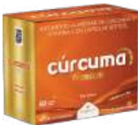
Cúrcuma Premium LA SAN-DAY c/ 60 cáps. | cód. 751209