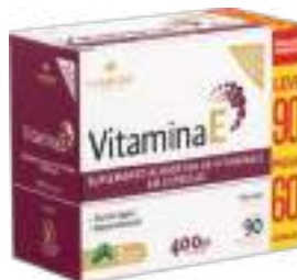
Vitamina E LA SAN-DAY Leve 90 Pague 60 cáps. | 400UI | cód. 738799