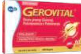
Gerovital c/ 60 cáps. | cód. 658447