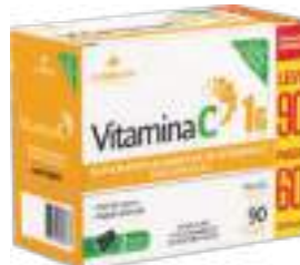
Vitamina C LA SAN-DAY Leve 90 Pague 60 cáps. | 1g | cód. 739071