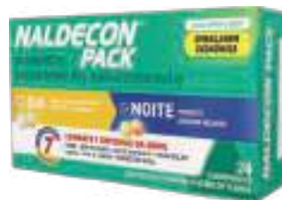
Naldecon Pack c/ 24 comp. | cód. 712888