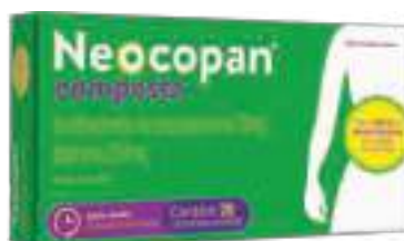
Neocopan Composto c/ 20 comp. | 10mg + 250mg | cód. 713339