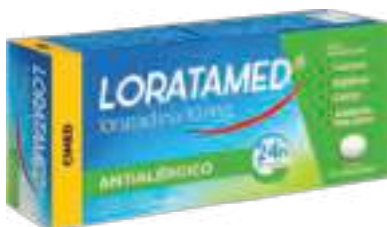
Loratamed c/ 12 comp. | 10mg | cód. 699138