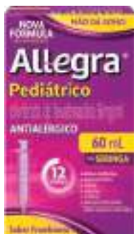
Allegra Pediatríco | 60ml | 6mg/ml | cód. 709603