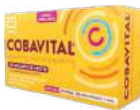
Cobavital c/ 30 comp. | cód. 732472