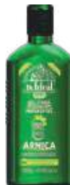
Gel para Massagem Arnica Dr. Ideal 240g | cód. 720847