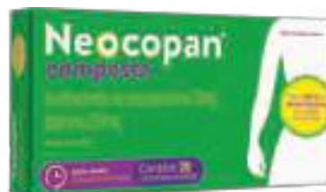
Neocopan Composto c/ 20 comp. | 10mg + 250mg | cód. 713339