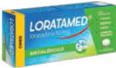
Loratamed c/ 12 comp. | 10mg | cód. 699138