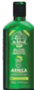
Gel para Massagem Arnica Dr. Ideal 240g | cód. 720847