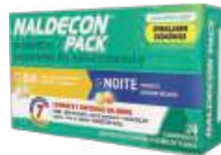
Naldecon Pack c/ 24 comp. | cód. 712888