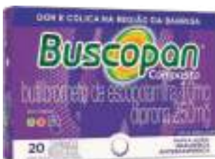
Buscopan Composto c/ 20 comp. | 10mg + 250mg | cód. 7492