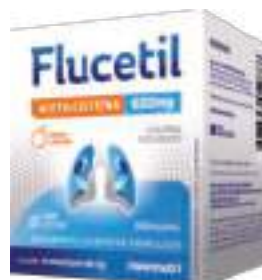
Flucetil c/ 16 envelopes | 5g | 600mg | cód. 745907