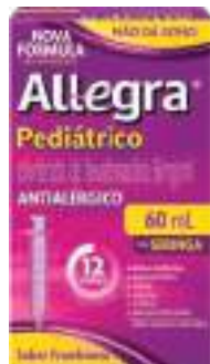
Allegra Pediátrico | 60ml | 6mg/ml | cód. 709603