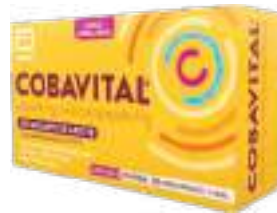
Cobavital c/ 30 comp. | cód. 732472