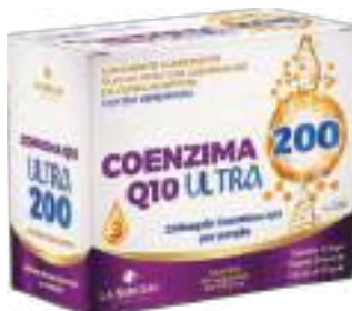
Coenzima Q10 Ultra 200 LA SAN-DAY