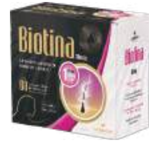
Biotina LA SAN-DAY