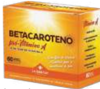
Betacaroteno Pró-Vitamina A LA SAN-DAY