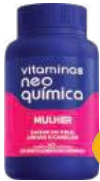
Vitaminas Neo Química Mulher c/ 60 comp. | cód. 741305