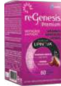
Regenesis Premium c/ 60 cáps. | cód. 746522