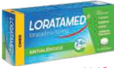
Loratamed c/ 12 comp. | 10mg | cód. 699138