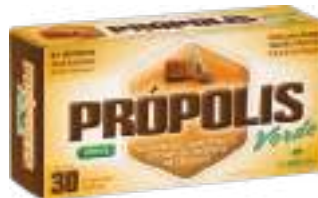
Própolis Verde LA SAN-DAY