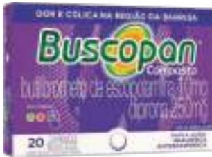
Buscopan Composto c/ 20 comp. | 10mg + 250mg | cód. 7492