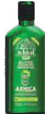
Gel para Massagem Arnica Dr. Ideal 240g | cód. 720847