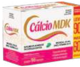
Cálcio MDK LA SAN-DAY

Leve 90 Pague 60 cáps. | 1450mg | cód. 735124