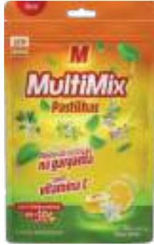
Multimix Pastilhas com Vitamina C

c/ 10 pastilhas | Sabor Limão-Menta | cód. 751234