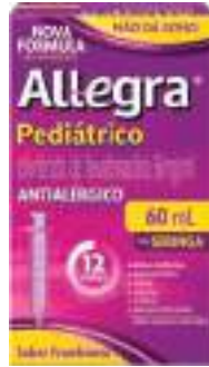
Allegra Pediátrico | 60ml | 6mg/ml | cód. 709603