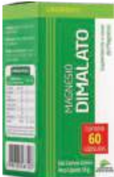
Magnésio Dimalato c/ 60 cáps. | cód. 742025