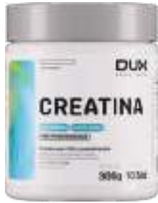
Creatina Dux 300g | cód. 748368