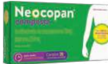
Neocopan Composto c/ 20 comp. | 10mg + 250mg | cód. 713339