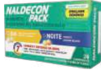
Naldecon Pack c/ 24 comp. | cód. 712888