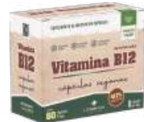
Vitamina B12 LA SAN-DAY