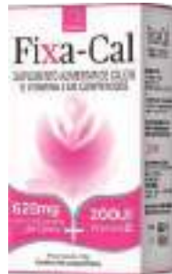
Fixa-Cal c/ 90 comp. | cód. 699475