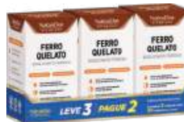
Ferro Quelato Natusday

c/ 30 cáps. | Leve 3 Pague 2 | cód. 752314