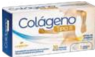
Colágeno Tipo II LA SAN-DAY